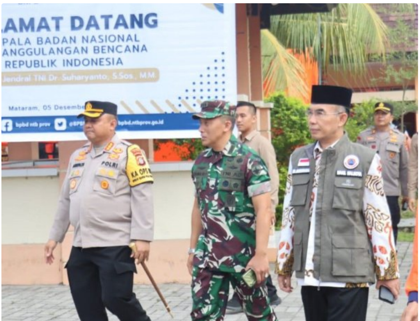
Kapolresta Mataram (Kiri) saat menghadiri acara Peletakan batu Pertama pembangunan gedung Pusdalops BPBD NTB, Kamis (05/12/2024)