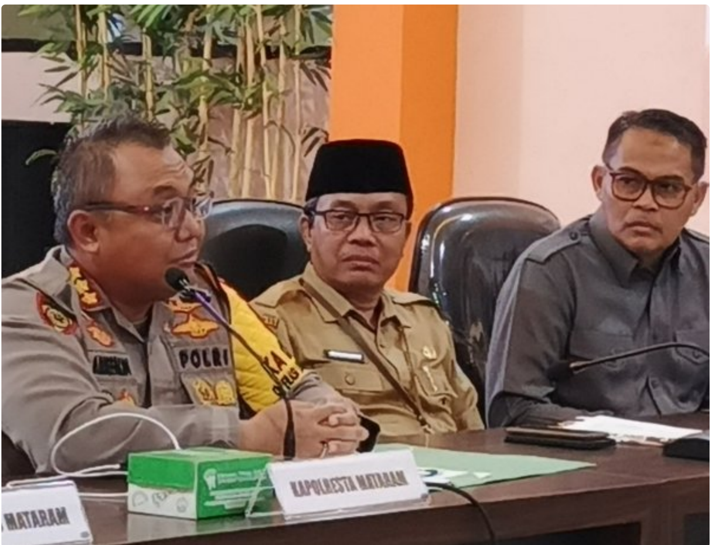
Kapolresta Mataram (Kiri) saat memimpin Konferensi pers akhir tahun, Selagi (31/12/2024)

MATARAM, NTB – Polresta Mataram mengakhiri tahun 2024 dengan menggelar Konferensi Pers Akhir Tahun, sebuah forum transparansi untuk memaparkan capaian dan inovasi yang telah dilakukan selama satu tahun. Kegiatan yang